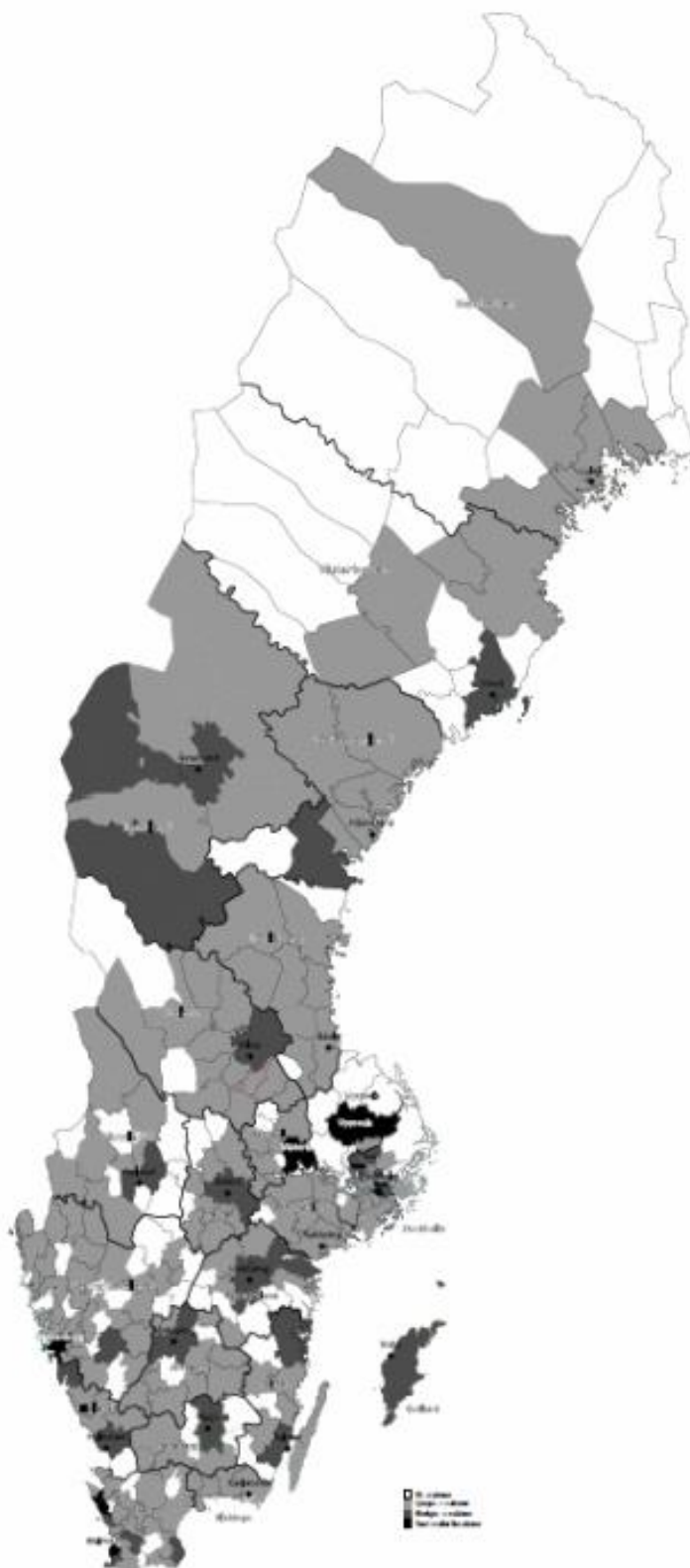
Figur 2 Coworkingaktörer per kommun

Anmärkning: Vit: 0; Ljusgrå: 1-4; Mörkgrå: 5-9; Svart: 10 eller fler.