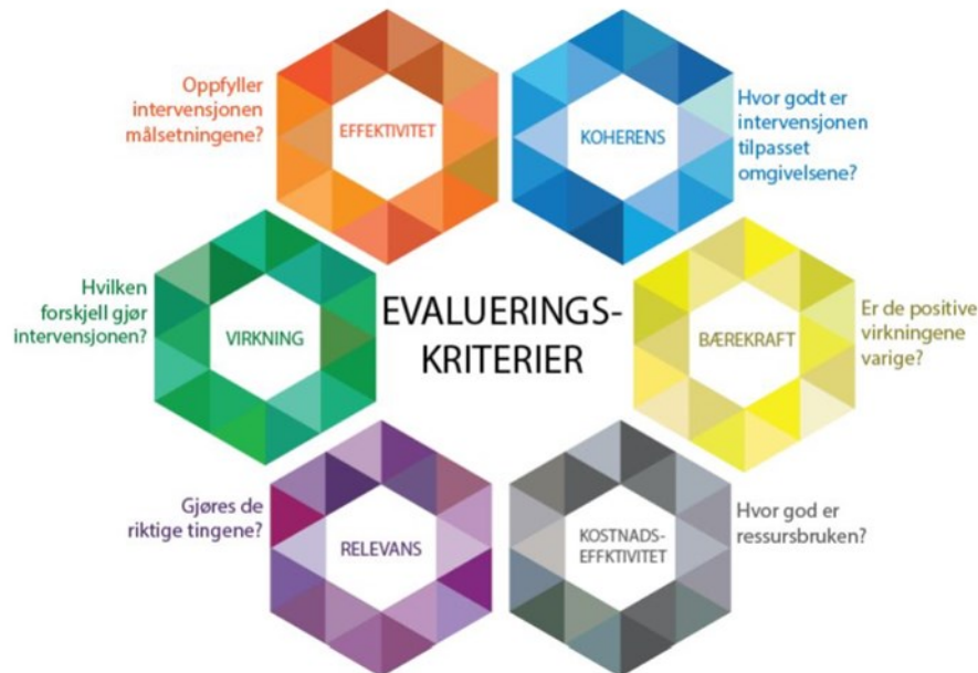
Figur 1 Overordnet evalueringsmodell